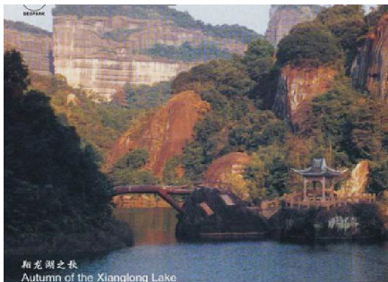
翔龙湖之秋 Autumn of the Xianglong Lake